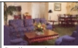
Studioapp. bzw. Wohnraum im Zweiraum- appartement

Ort: New York Hotel: Affinia Southgate Tower Lage: Zentrale Lage 7 th Ave. gegenüber Pennsylvania Station und Madison Garden. Empire Bldg ca. 250 Meter; U-Bahn Station 50 m. Ausstattung: Appartementhotel mit Restaurant, Bar, Fitnessraum Zimmer: gesamt 523 Studioapp: (1-2 Personen): großer Wohn/Schlafraum mit Doppelbettcouch, Bad/WC, keine Küche Zweiraumappartement (Onebedroom) (bis 4 Pers.): Doppelschlafzimmer, großer Wohnraum mit Doppelbettcouch; Bad/WC, kompl. Küche. $$$$